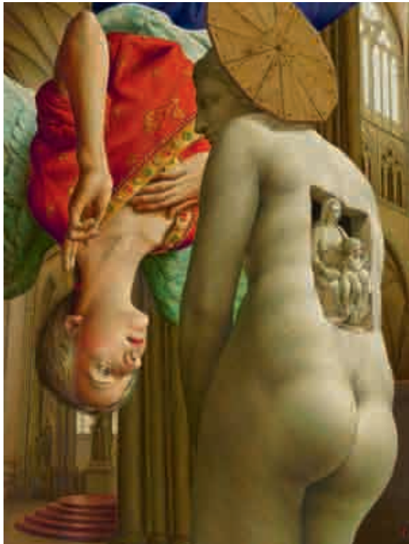
Michael Triegel, Renaissance , 2015.