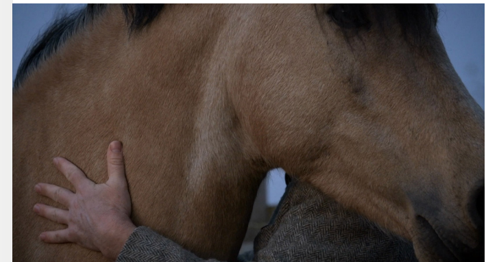
↓ Film still: Yalda Afsah, Centaur , 2020, HD Video, stereo sound, 13 min.

CENTAUR: HUMAN AND HORSE – A FILM INSTALLATION Coinciding with World Equestrian Games, the Ludwig Forum presents two short films in the museum’s central hall. Each offers a strikingly different take on the relationship between human and horse. The installation takes its name from Centaur (2020), a film by German-Iranian artist and filmmaker Yalda Afsah (b. 1983), whose work probes the complex dynamics between humans and animals. Poised between care and control, the film offers extensive insights into the microcosm of dressage. Swiss artist duo Marianne Halter (b. 1970) & Mario Marchisella (b. 1972) approach the subject from a different angle in Pferde über Wiese [Horses Across Meadowlands] (2014), applying a poetic, gently humorous touch. The short film follows a break-neck-speed ride on a bicycle and disrupts the relationship between image and sound.